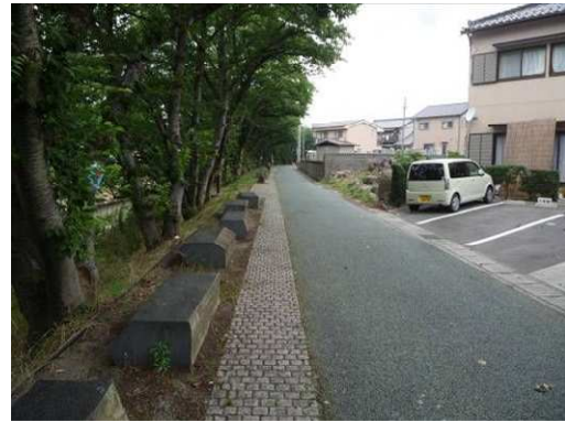
左岸（尾北自然歩道）