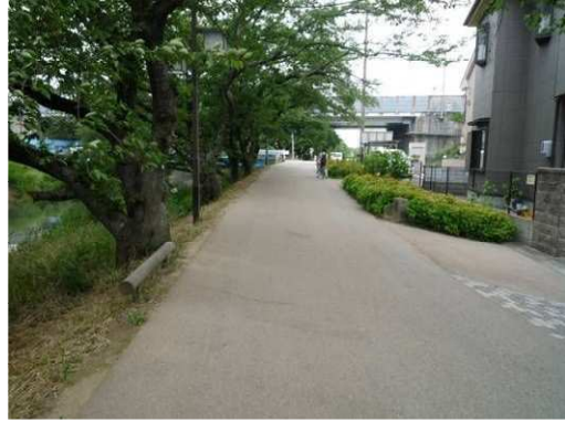
左岸（尾北自然歩道）