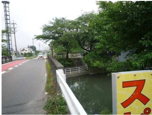
左岸名神側道北橋アンダーパス