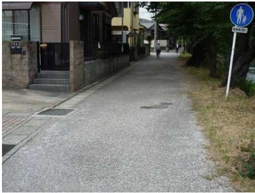
右岸（尾北自然歩道）