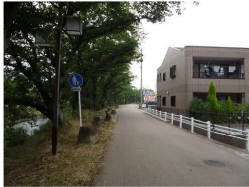
左岸（尾北自然歩道）