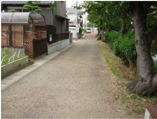
右岸（尾北自然歩道）