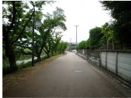
左岸（尾北自然歩道）