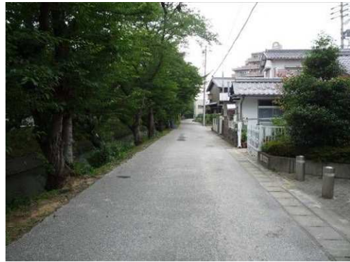
左岸（尾北自然歩道）