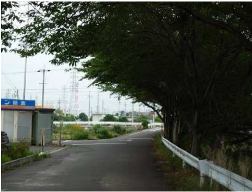
右岸（尾北自然歩道）