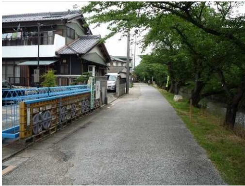
右岸（尾北自然歩道）