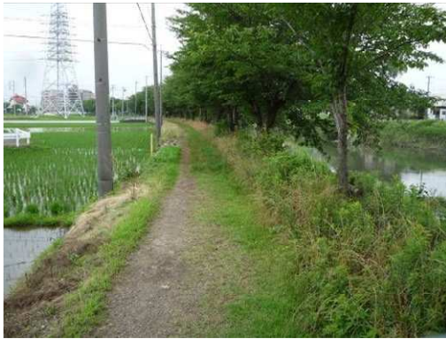
右岸（尾北自然歩道）