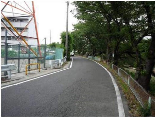
右岸（尾北自然歩道）