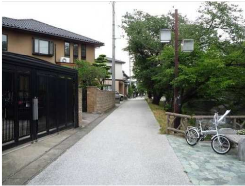
右岸（尾北自然歩道）