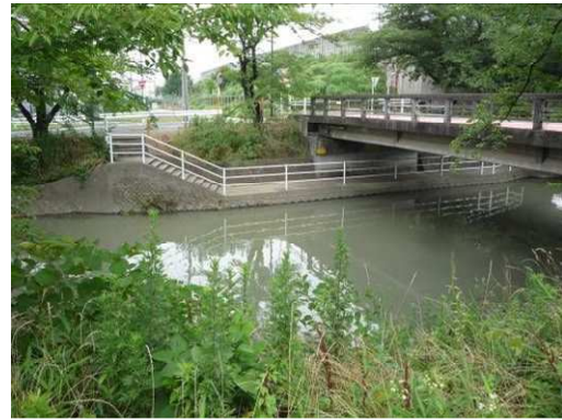
左岸名神側道北橋アンダーパス