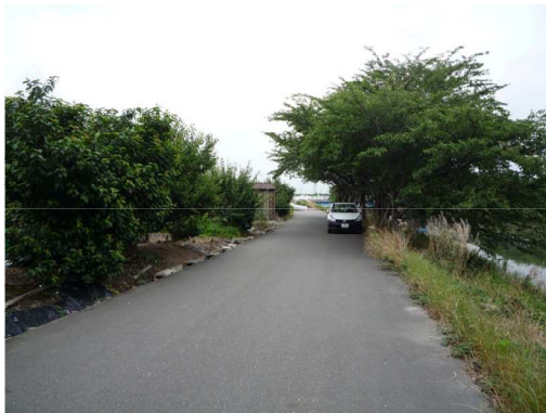
右岸（尾北自然歩道）