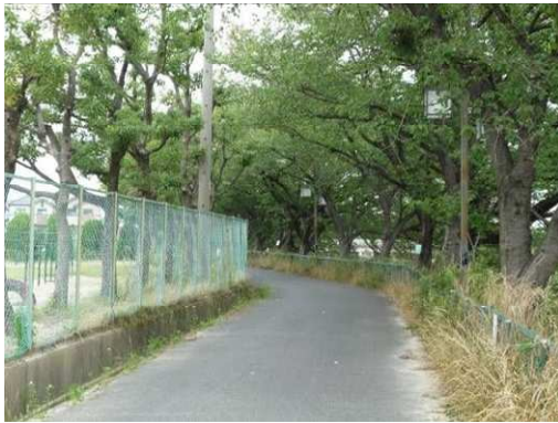
右岸（尾北自然歩道）