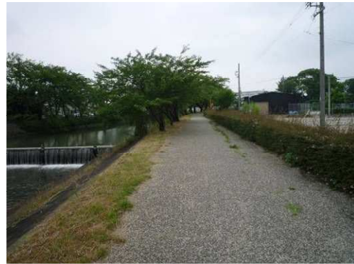
左岸（尾北自然歩道）