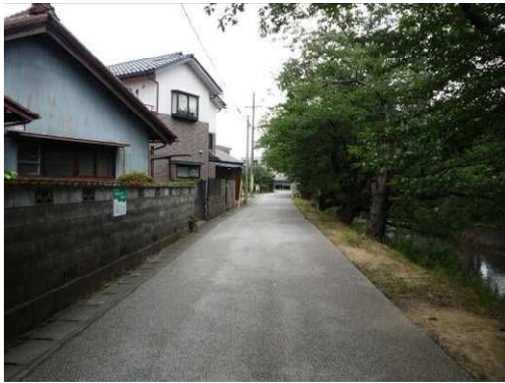
右岸（尾北自然歩道）