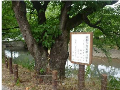
左岸ソメイヨシノ観測用標本