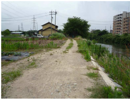
右岸（尾北自然歩道）