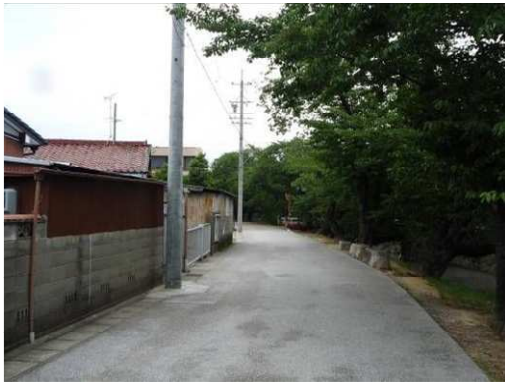
右岸（尾北自然歩道）