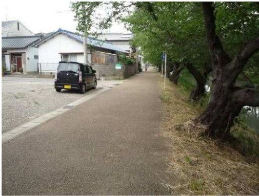
右岸（尾北自然歩道）