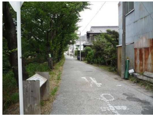
左岸（尾北自然歩道）