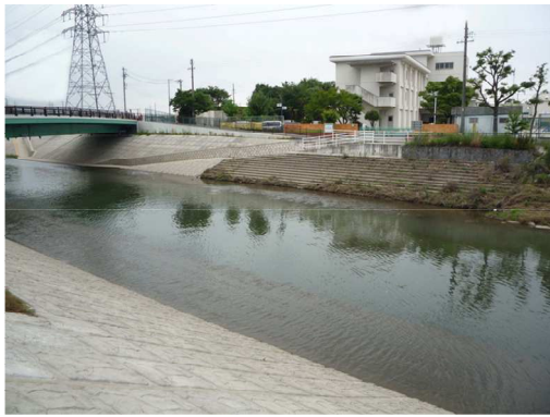
右岸出逢橋アンダーパス