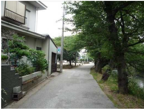
右岸（尾北自然歩道）