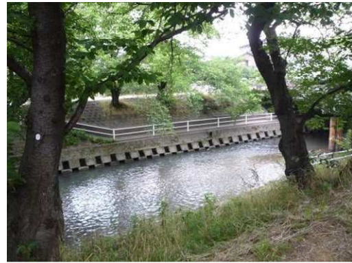
右岸豊国橋アンダーパス