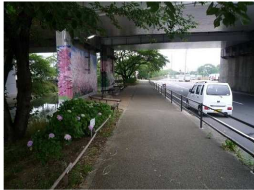
左岸（尾北自然歩道）