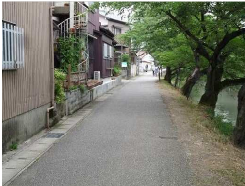
右岸（尾北自然歩道）