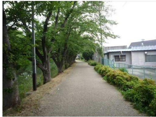
左岸（尾北自然歩道）