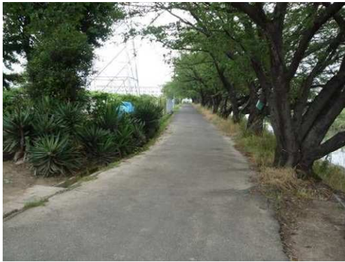
右岸（尾北自然歩道）