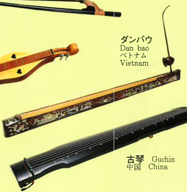
古琴 Guchin 中国 China