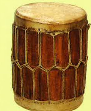
桶胴 Okedo 日本 Japan