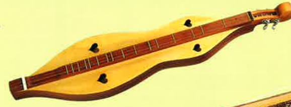
アパラチアン・ダルシマー Appalachian dalcimer アメリカ・ペンシルベニア州 U.S.A