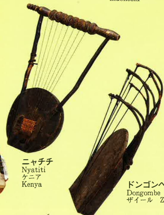
ドンゴンベ Dongombe ザイール Zaire