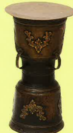
モッコ Mokko インドネシア・アロル島 Indonesia