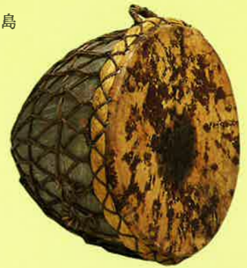
ナガラ Nagara インド India