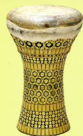
ダラブッカ Darabukka エジプト Egypt