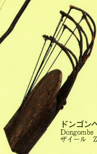
ドンゴンベ Dongombe ザイール Zaire