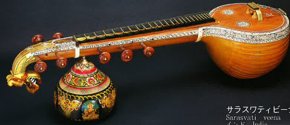
サラスワティビーナ Saraswati veena インド India