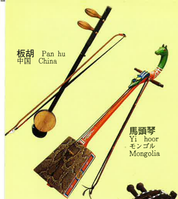
馬頭琴 Yi hoor モンゴル Mongolia