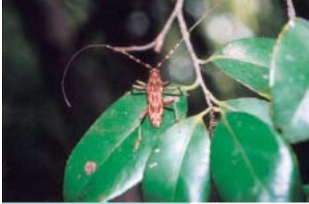
キマダラカミキリ