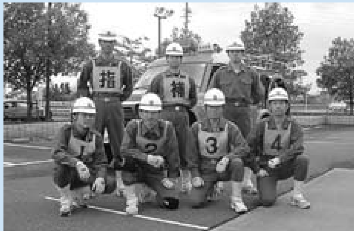
岩倉市代表選手の皆さん

昨年は3位入賞を成し遂げ、今年は優勝を目指し、現在五条川小学校グラウンドで厳しい早朝訓練(午前5時30分～7時、日曜日は休み)を実施しています。市民の皆さんの応援をお願いします。