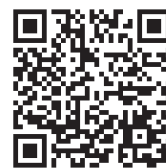
申し込みフォーム 二次元コード