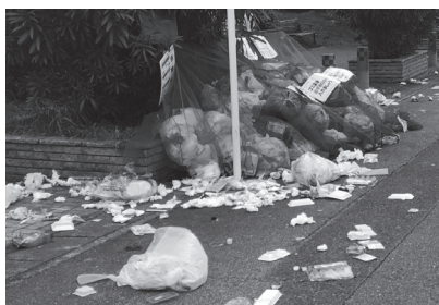
【実際にカラスに荒らされたごみ集積場所】

ネットが設置されているごみ集積場所については、カラスがごみに触れることのできないよう、ごみをしっかりと覆うようにネットを被せると被害が少なくなります。この際、ネットに隙間ができないように被せてください。