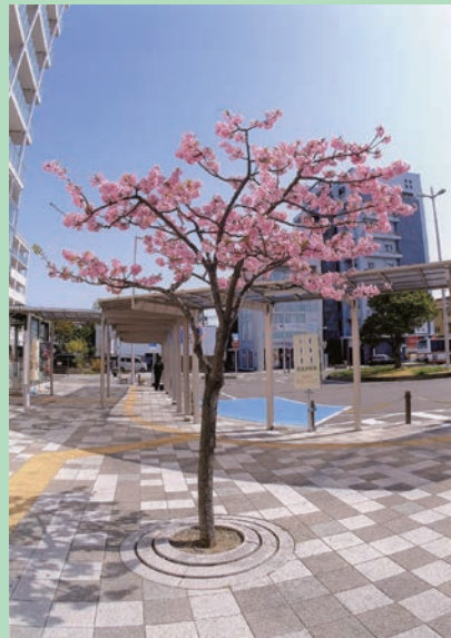
3月10日(金)、岩倉駅東側の小牧行きバス停近くの早咲きの桜、河津桜が満開になり、バス待ちの人々の微笑が感じられました。