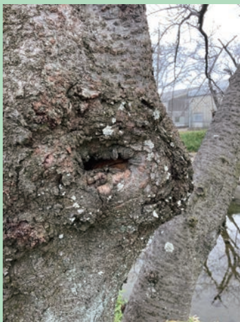
桜の木なのに何か動物の横顔に見えた～ 井上町五条川畔にて (神野町 くらばあばさん)