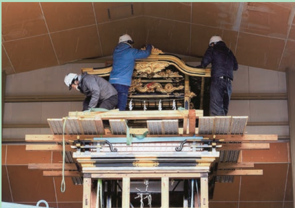
2月23日（木・祝）、中本町山車保存会の山車屋根の修繕が終わり取付作業が行われました。 お披露目は、4月の山車巡行日です。