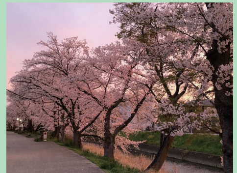
仕事帰りのお花見。夕暮れ時の五条川 沿いにて。