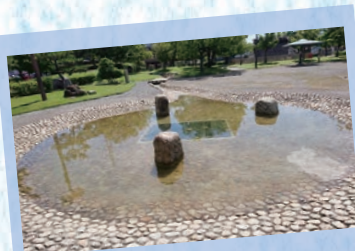
【史跡公園】 木陰で休みながら水のせせらぎを聞くことができます。 グレープタイザーさん