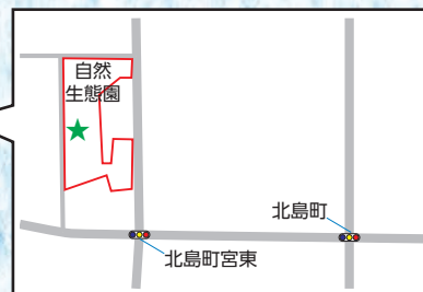
PHOTO NEWS まちの話題