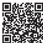
市ホームページ (秋開始接種)

現在、令和5年秋開始接種(9月20日から令和6年3月31日までの間に1人1回接種)および初回接種を実施していますが、接種者数の減少に伴い、岩倉市新型コロナワクチン接種コールセンターおよびWebでの接種の予約受付は、12月28日(水)をもって終了します。以降のワクチン接種の予約については、指定の医療機関での受付の予定です。詳細については決まり次第、広報いわくら、市ホームページ、ほっと情報メール、LINE等でお知らせします。