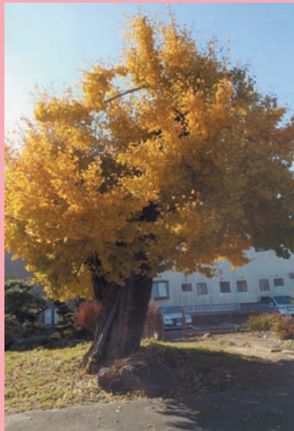
樹齢 200 年ほどのわが家のイ チョウの大木です。 (曾野町 まりちゃんさん)