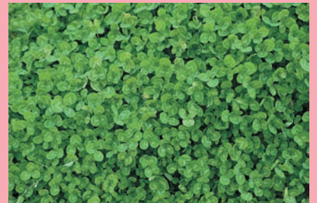
畑の隅にクローバーがたくさん。四 つ葉のクローバーはあるかな？ (大市場町 やすおさん)