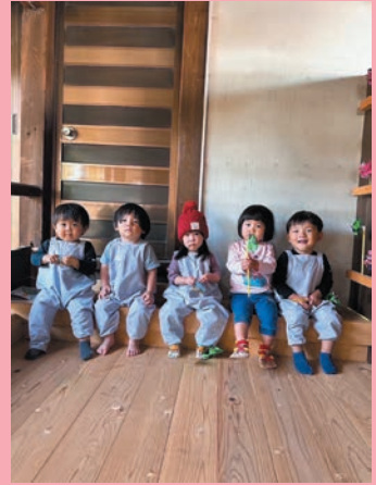
岩倉のパワースポット長遠寺さん！ みんな揃ってハイチーズ♡ (鈴井町 なっちさん)