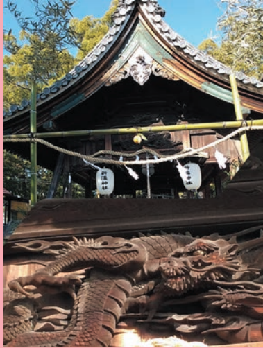
新溝神社 拝殿軒下に龍の彫り物 (新柳町 きさらぎさん)