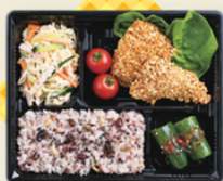
カムカム弁当(イメージ写真)