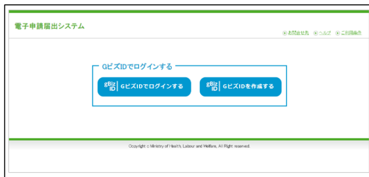
【本システムのログイン画面イメージ】

本システムでご利用できるGビズIDのアカウント種類は、「gBiz IDプライム」と「gBiz IDメンバー」のみになります。