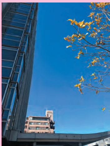
(旭町 ico さん)