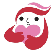
犯罪被害者等支援シンボルマーク ギュっとちゃん