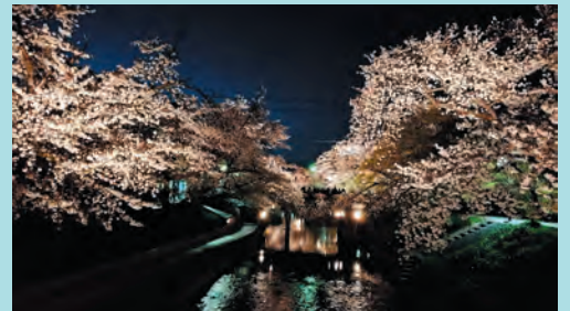
五条川の夜桜です。