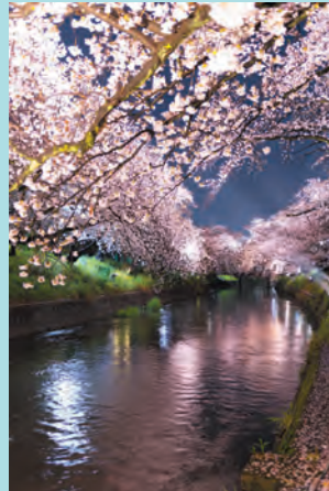
(東新町 うっき〜 さん)